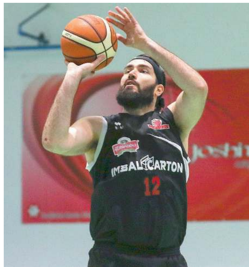
Mvp. Altra grande prova per Raskovic che ha messo a referto 24 punti

Decisiva la prossima in casa con Seriana per Sarezzo, sicura del secondo posto da diverse giornate Prevalle. //